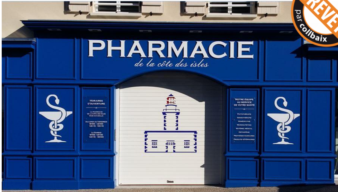
Mod. MASTER DEKORA laqué Blanc RAL 9010 avec le motif fourni par le client