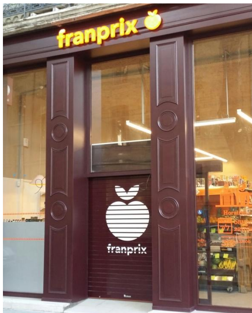
Mod. MASTER DEKORA laqué Blanc RAL 3007