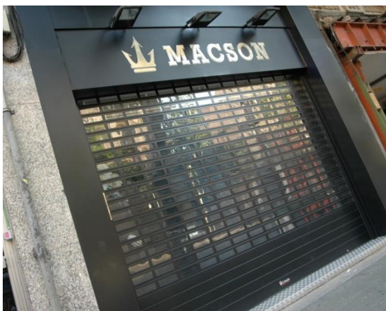
Mod. SATEN lacado Negro Mate