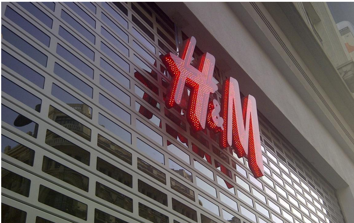
Mod. SATEN anodizado Plata Mate