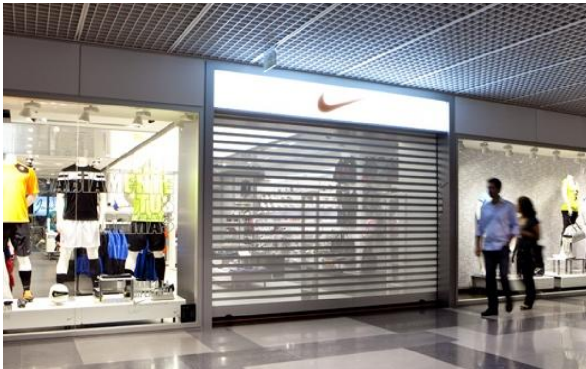
Mod. MICROBAIX anodizado Plata Mate