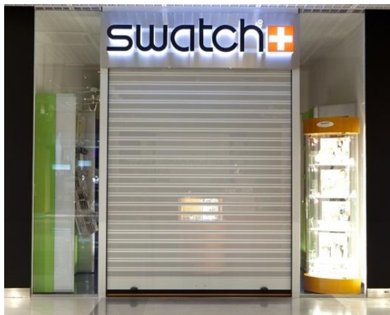
Mod. MICROBAIX anodizado Plata Mate