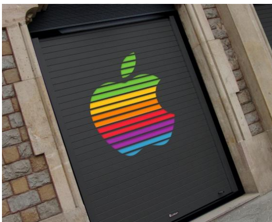
Mod. MASTER DEKORA lacado Negro Mate RAL9011