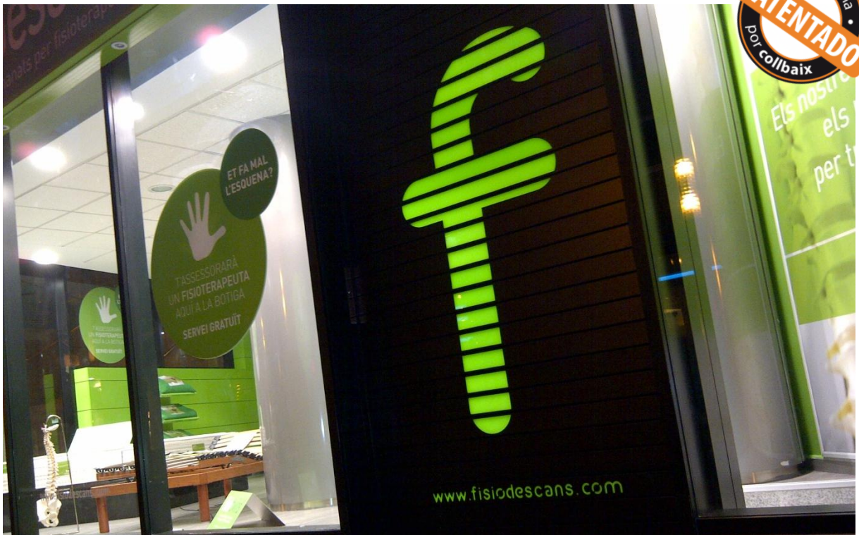
Mod. MASTER DEKORA Lacada Negro Mate RAL 9011