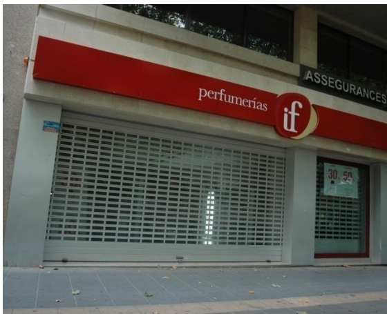
Mod. IRIS anodizado Plata Mate