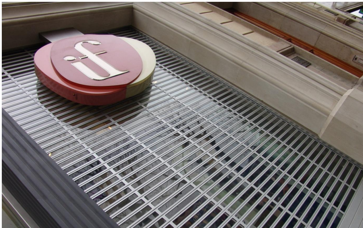
Mod. SEGURTRANS ESPECIAL anodizado Plata Mate