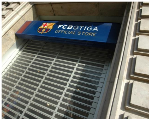
Mod. SEGURTRANS ESPECIAL anodizado Plata Mate