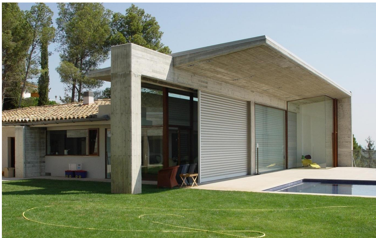
Mod. MICROBAIX anodizado Plata Mate