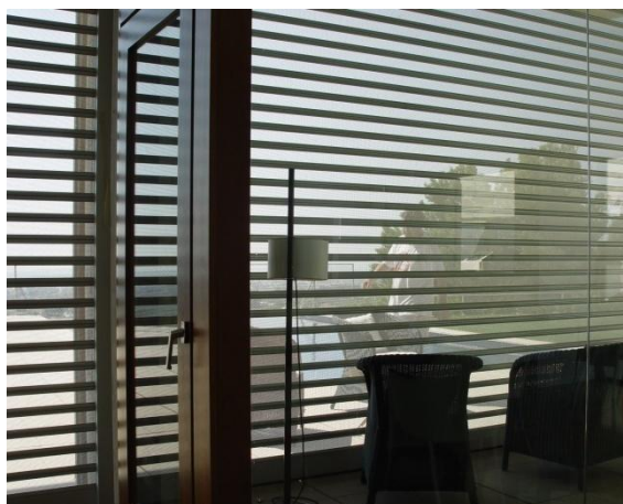
Mod. MICROBAIX anodizado Plata Mate