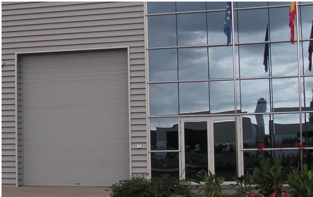
Mod. MASTER TERMIC Lacada RAL 9006