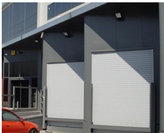
Mod. MASTER TERMIC Lacada RAL 7035