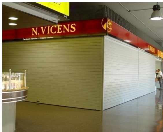
Cajón BASICPLUS aluminio + Guía 95x40