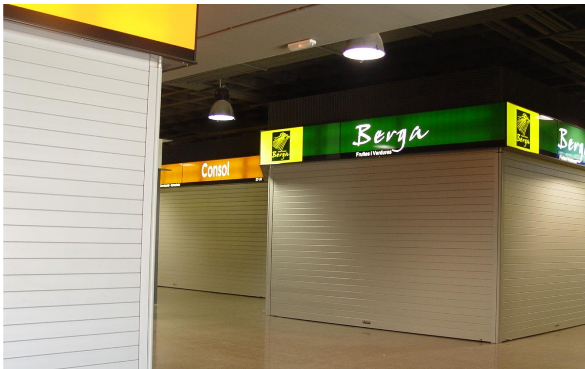
Mod. MASTER TERMIC Lacada en RAL 9010