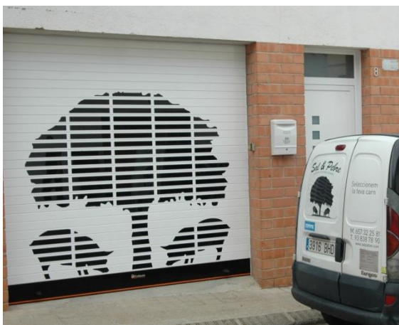
Mod. MASTER DEKORA lacado RAL 9010