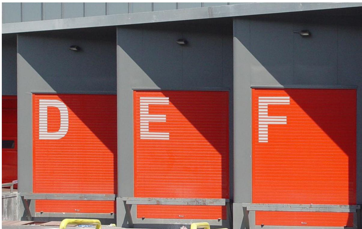
Mod. MASTER DEKORA Lacada RAL Especial

Diferénciese del resto o identifique sus puertas