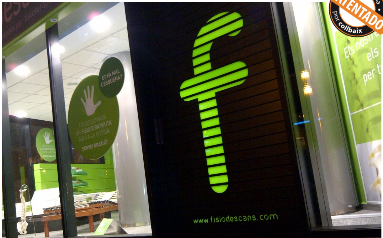
Mod. MASTER DEKORA Lacada Negro Mate RAL 9011