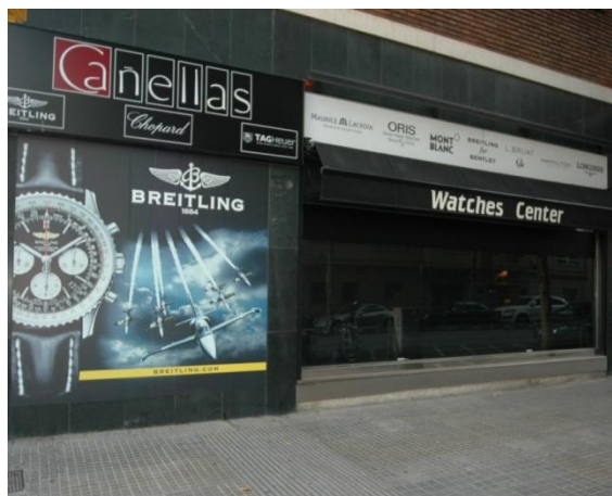
MASTER BLIND lacada RAL 9011 Negro Mate