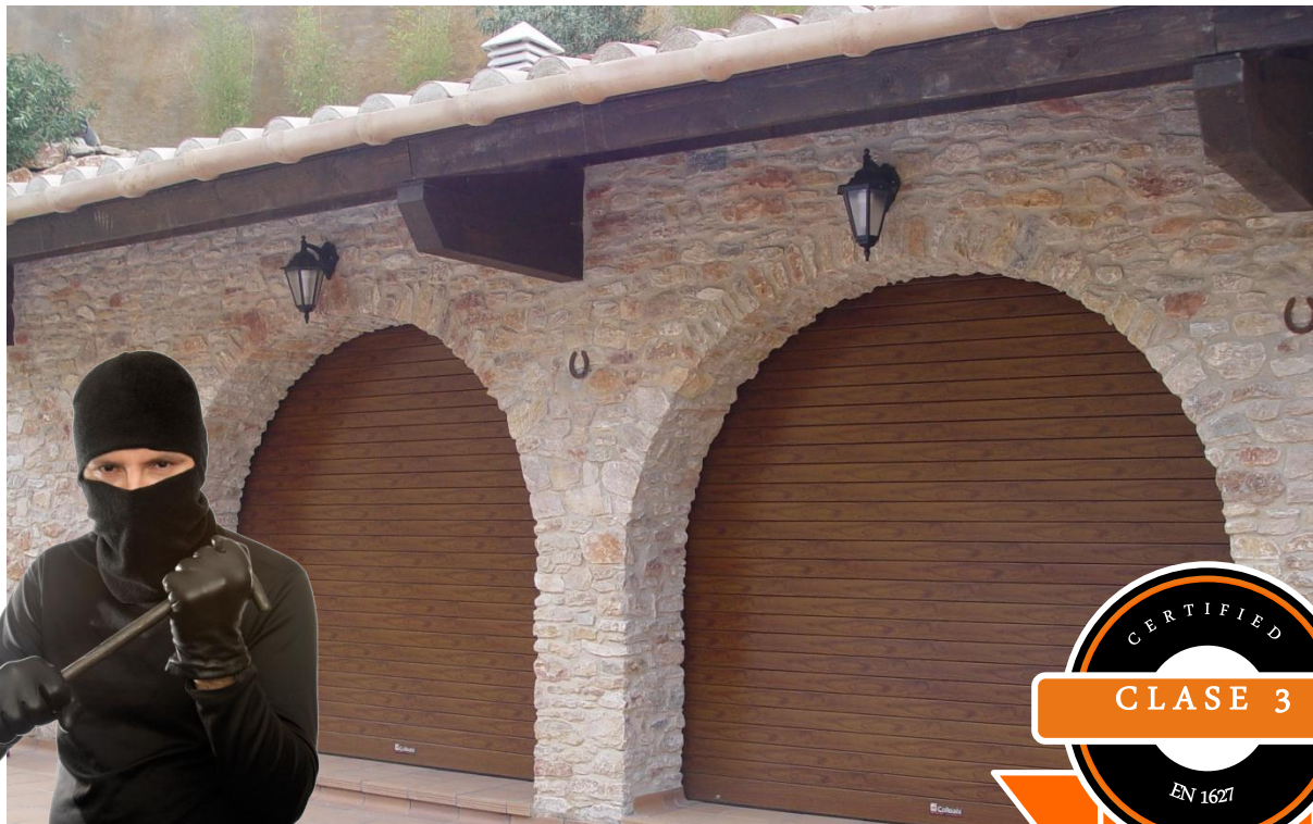
Mod. SECURBAIX THERMIC en lacado Madera