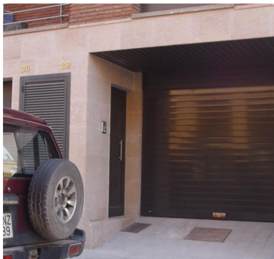
Mod. SECURBAIX THERMIC en RAL 9011