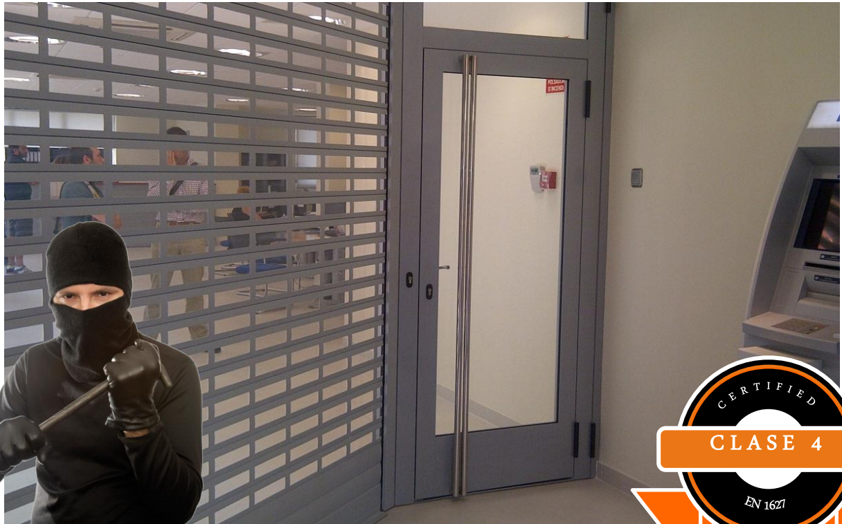
Mod. SECURBAIX BL VISION en una oficina bancaria