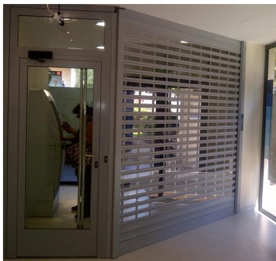
Mod. SECURBAIX BL VISION en Anodizado Plata Mate