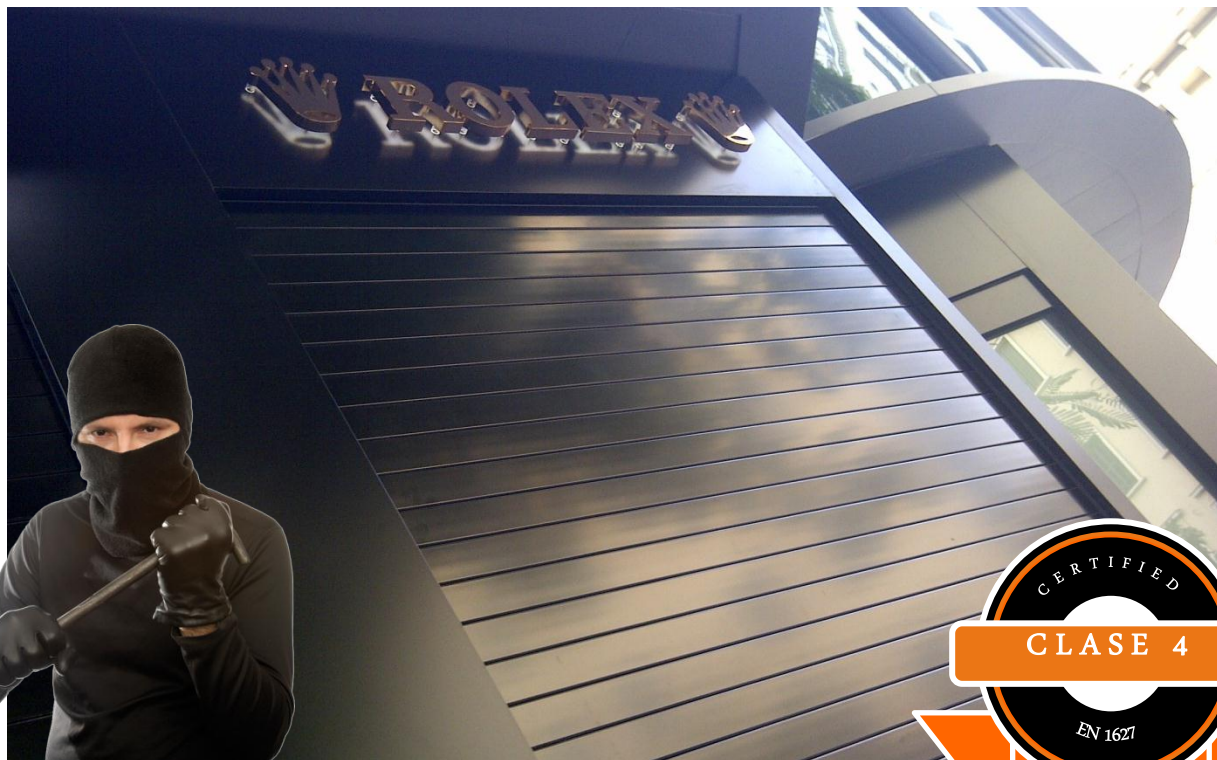
Mod. SECURBAIX BL en Anodizado Plata Brillo

MÁXIMA SEGURIDAD CERTIFICADA para Negocios de Alto Valor