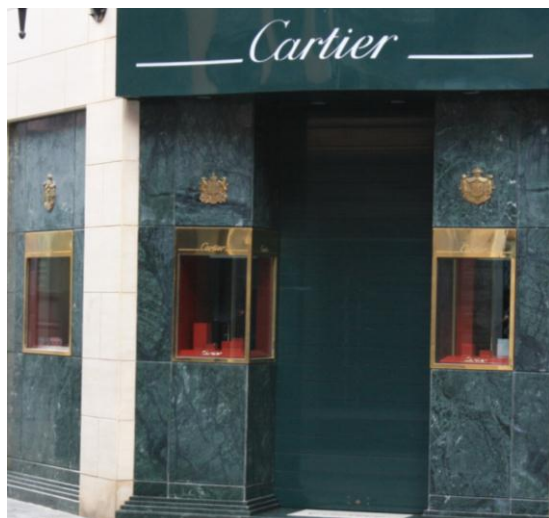
Mod. SECURBAIX BL en Ral 6009