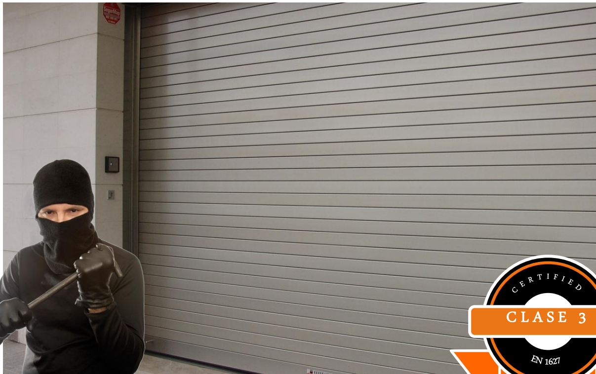
Mod. SECURBAIX en Anodizado Plata Mate