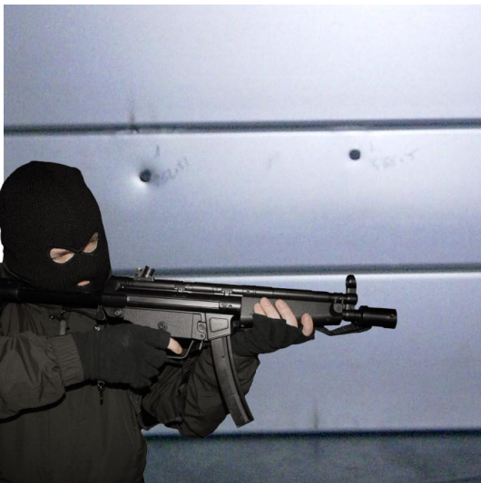
Perfil ANTI BALA de 100 mm de altura. Nivel FB6-S