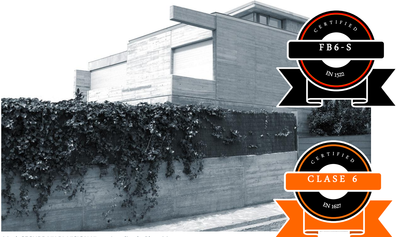
Mod. SECURBAIX BL VISION XL en Anodizado Plata Mate