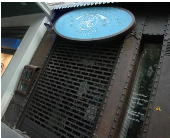
Mod. ASTRAL anodizado Plata Mate