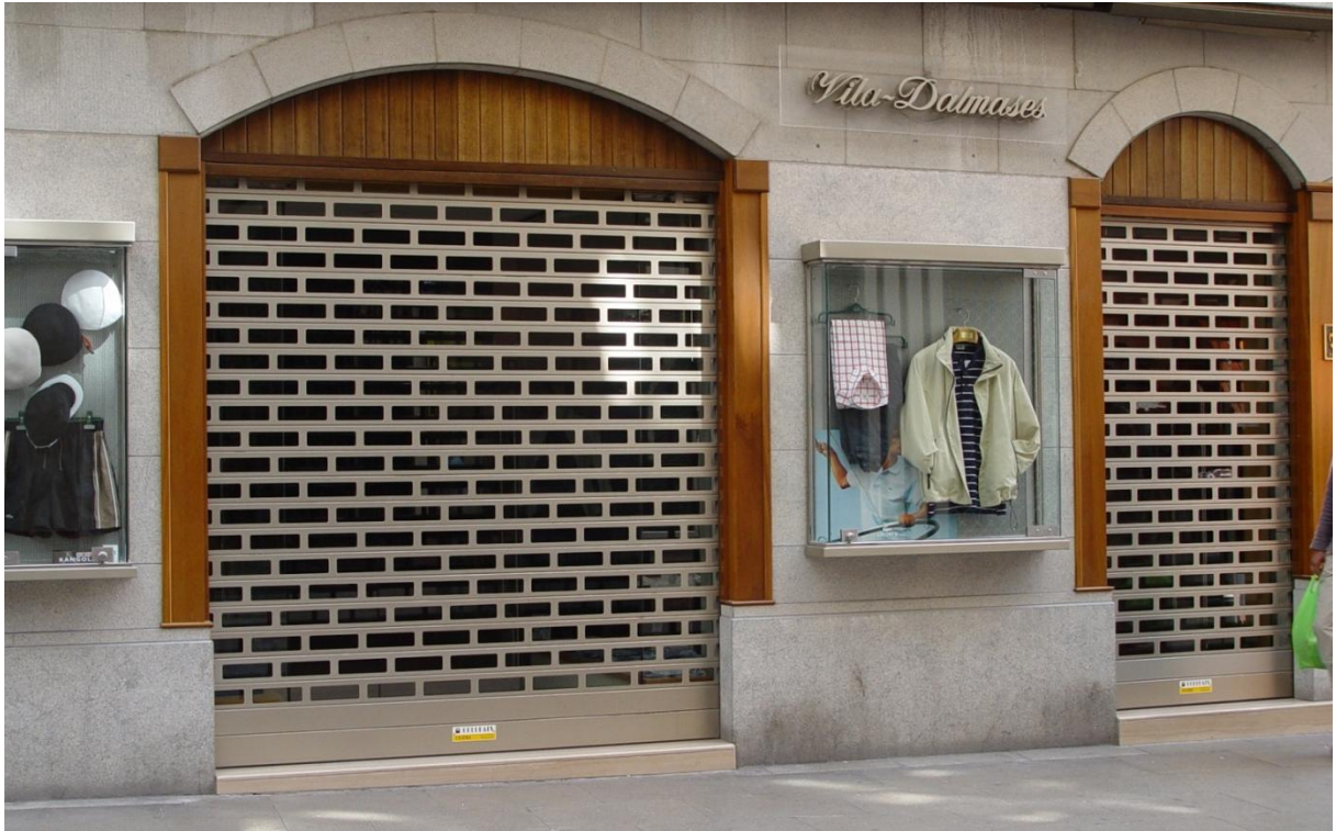
Mod. ASTRAL anodizado Inox Lij+Rep