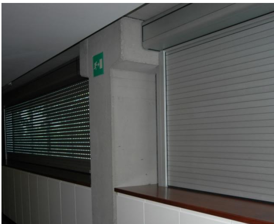
Detalle de los troqueles de luz / ventilación