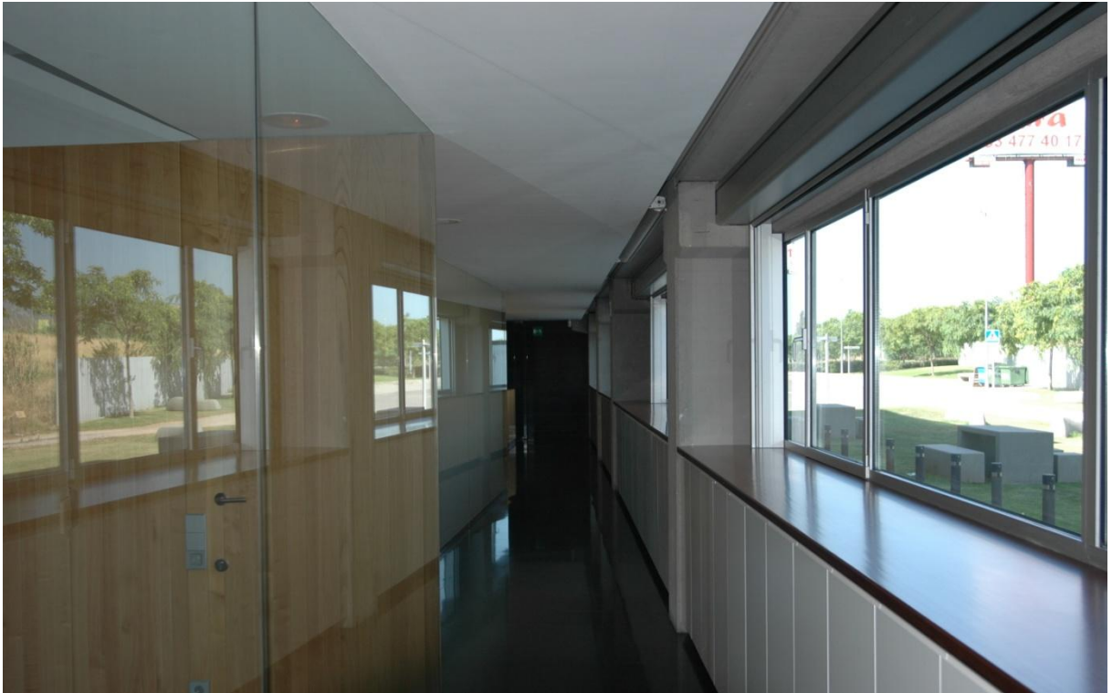
Mod. SILENCE 45-R anodizada Inox Lij+Rep